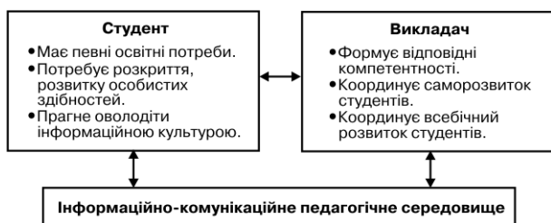
Рис. 1. Схематична модель трисуб'єктних відносин

Одним із варіантів побудови означеного середовища в умовах вищого навчального закладу була розро-