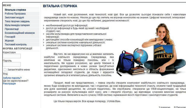
Рис. 2. Вітальна сторінка Web-мультимедія енциклопедії «Історія педагогіки»

Теоретичні завдання — озброїти майбутніх учителів початкових класів знаннями про місце ІКТ в початковій освіті, принципи побудови уроку з комп'ютерною підтримкою; медичні, гігієнічні та психологічні особливості використання комп'ютерної техніки в початковій школі; проектування та створення програмного забезпечення навчального призначення; основи складання програмного забезпечення контрольно-оцінювального характеру (електронні тести, кросворди, вікторини) і вимоги до нього; уявлення про