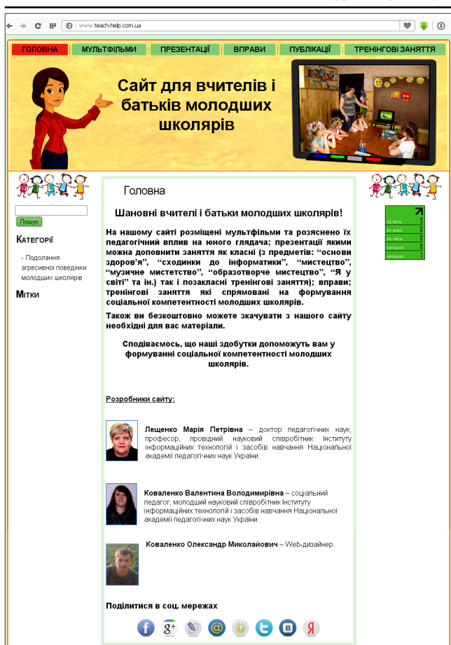
Рис. 1. Головна сторінка сайту http://www.teach-help.com.ua/

Ресурси і обладнання: мультимедійна дошка/проектор, ноутбук/комп'ютер, мультимедійна презентація. Можете заздалегідь знайти значення імен по кожному учню, або ж дати завдання учням дізнатися у своїх батьків значення їхніх імен (взяти інтерв'ю у своїх батьків на тему «Значення мого імені»). І на наступному занятті розповісти свою історію всьому класу). Мультимедійна презентація на тему «Таємниця наших імен», у презентації розміщений не тільки текст, а й картинка подана на web-сайті: http://www.teach-help.com.ua/ . Міні-лекція виступає діалогом з учнями.