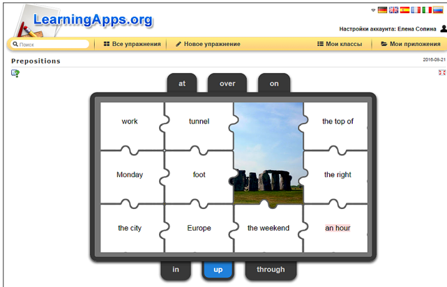
Рис. 8. Скриншот завдання на сервісі learningapps

Різноманітність вправ дозволяє залучити учнів до роботи, обирати індивідуальні або групові форми, залучити ігрову діяльність (рис. 8).