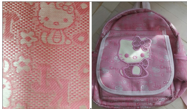
Рис. 7. Приклад фотографії

Завдання 6. «Last news». «You have one minute to find last news via the Internet in the Facebook and tell us about it».