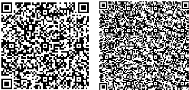
Рис. 1. Приклад QR-кодів

Для застосування цього сервісу необхідно: