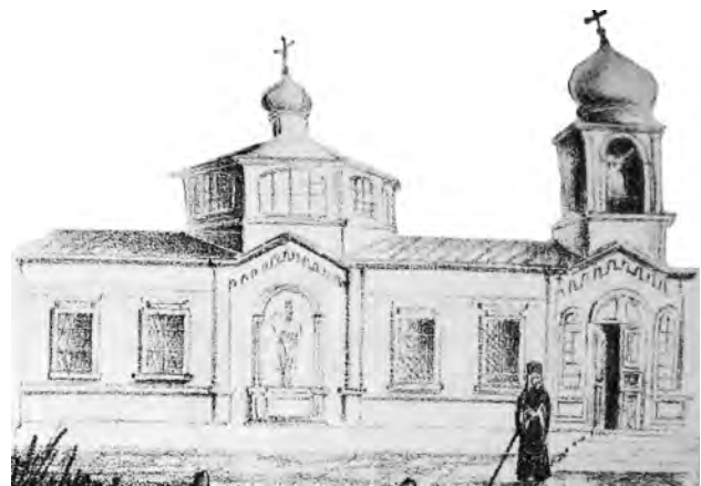
Кам'яна церква на честь Введення в храм Божої Матері (подвір'я Бахчисарайського Успенського скиту)