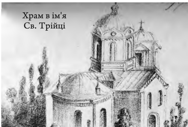
Храм в ім'я Св. Трійці

1796 року відбулося освячення храму в ім'я Св. Трійці, побудованого греками, що проживали в Сімферополі в той час. До середини XIX століття ця будівля стала старою і не могла вмістити усіх бажаючих. Тому була розібрана, а на її місці побудована нова великих розмірів і у витонченому архітектурному стилі на пожертви прихожан [11]. 1868 року церкву освятили [12]. Зовнішній та внутрішній вигляд з тієї пори не змінилися.