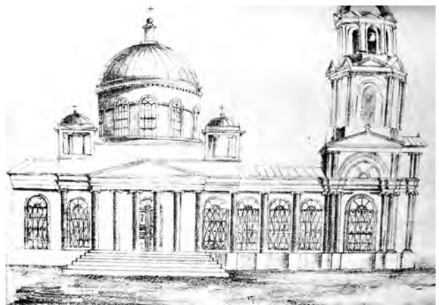
Кафедральний Собор в ім'я Св. Олександра Невського