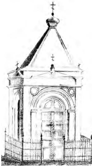
Каплиця в ім'я Св. Благівірного Князя Олександра Невського

Невського. У ній кожен неділю та середу здійснювали молебень з акафістом покровителів святині [68]. Споруда була знесена наприкінці 1920-х рр. (50-60-х роках ХХ століття [69]).