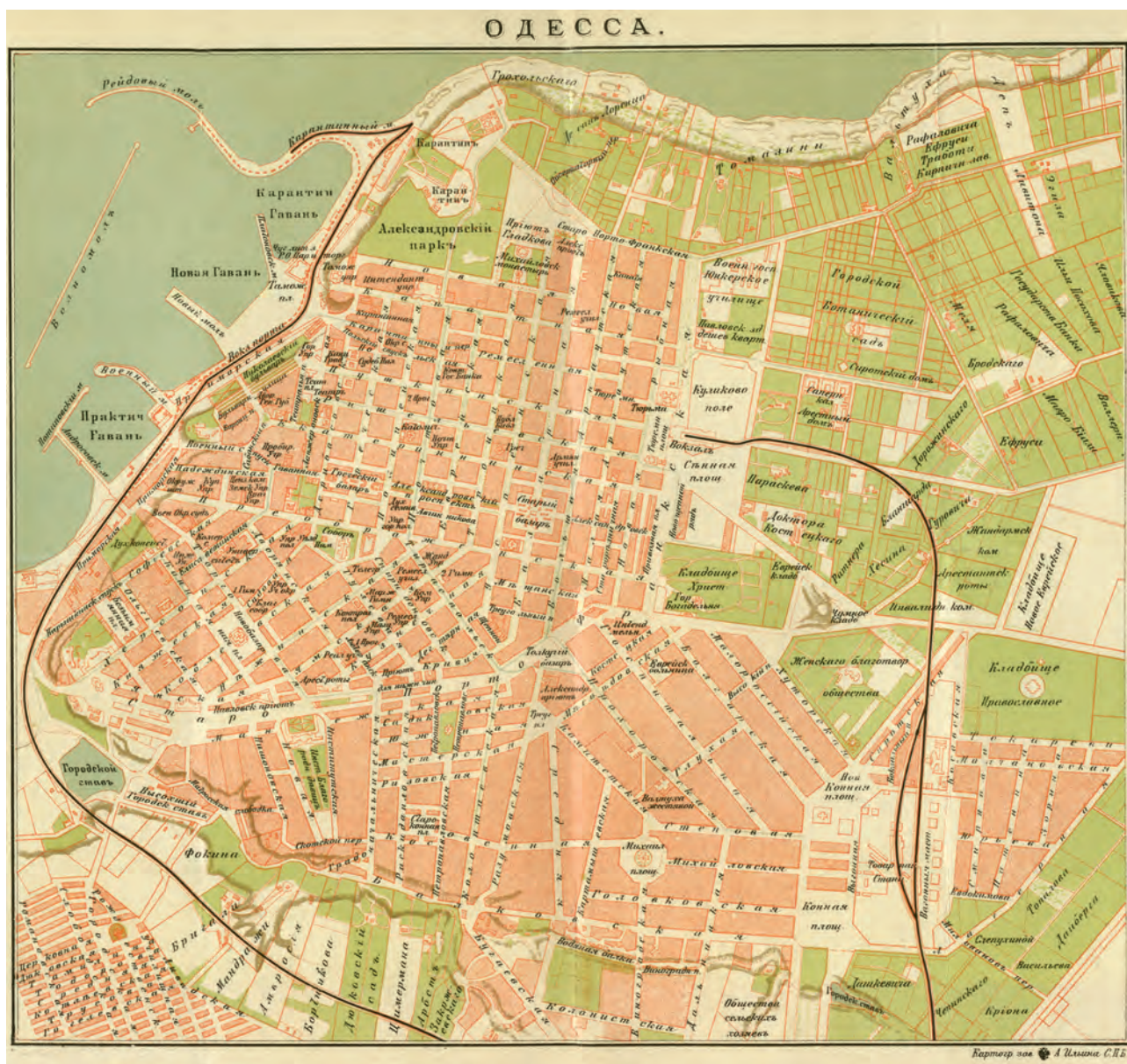
План міста Одеси кінця 19 ст.