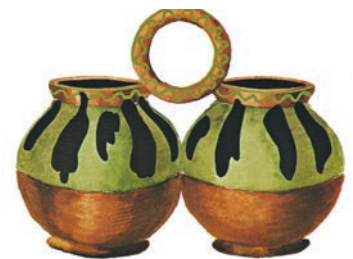
Близнюки, село Бубнівка, повіт Гайсин