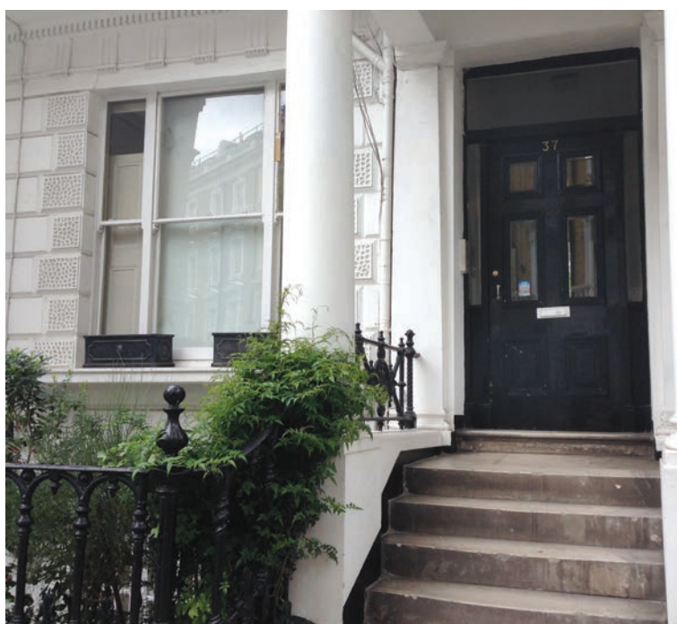
У кімнаті нижнього поверху цього будинку мешкав Вадим Щербаківський. 37 Linden Gardens, London W2.

та князем Яном Токаржевським-Карашевичем поділився споминами про відомого історика, громадського і державного діяча, якого знав ще з Києва, разом працював в УВУ в Празі та Мюнхені 29 .