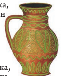
Глечик, село Бубнівка, повіт Гайсин