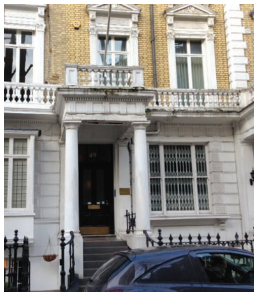
Будинок Союзу Українців у Великій Британії. 49 Linden Gardens, London W2.