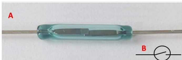
Рис. 1. А) Зовнішній вид геркона; В) позначення на принциповій схемі.