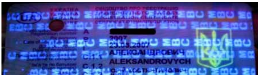
Рис. 2. Подвійне нанесення захисних плівок.