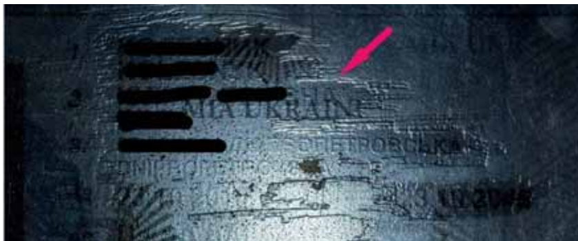
Рис. 1. Посвідчення водія, в яке вносились зміни.

документів про освіту та вчені звання, нотаріальних документів). Документ у вузькому сенсі – матеріальний носій, що містить певні відомості, який, наприклад, має текст, підпис і відтиск печатки, зареєстрований відповідним чином, тобто повністю оформлений за визначеними правилами. Слід звернути увагу, що, наприклад, паперові банкноти одночасно являються і бланком, і завершеним документом тому, що після їх виготовлення банкотно-монетним двором вони не потребують подальшого, так би мовити, дооформлення.