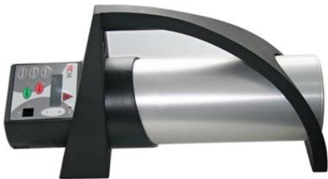
Рис.1. Переносні рентгенівські апарати «CP120» та «CP160»

Одним із прикладів сучасних розробок є рентгенівський генератор постійного потенціалу ICM CP 120-160 KB (див.рис.1).