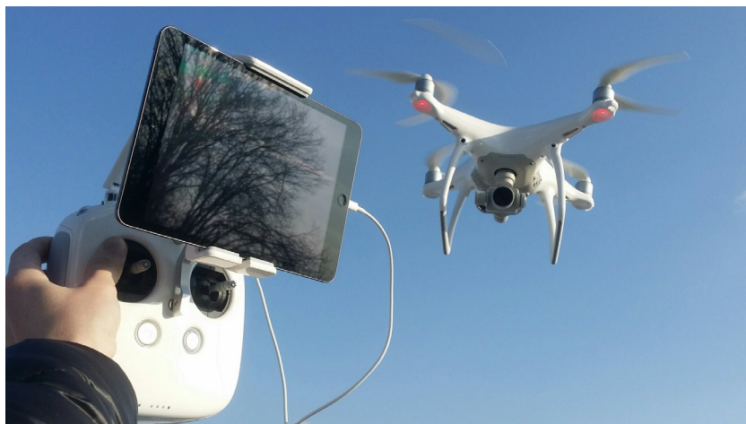
Рис.3. Зображення безпілотного летального апарату «Квадрокоптер» з пультом керування оператора

Останнім часом, все частіше при розслідування злочинів пов'язаних з вибухами, пожежами та дорожньо-транспортними пригодами, спеціалістами використовуються «безпілотні літальні апарати», технічні засоби повітряного обстеження та фіксації території на якій сталася пригода (див. рис. 3).