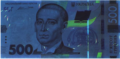
Рис. 5. Лицьовий бік банкноти номіналом 500 гривень зразка 2015 року, на якій відсутня люмінесценція бірюзовим кольором зображень, нанесених способом глибокого друку фарбою синього кольору (зйомка в УФ-променях, \lambda=365 нм)