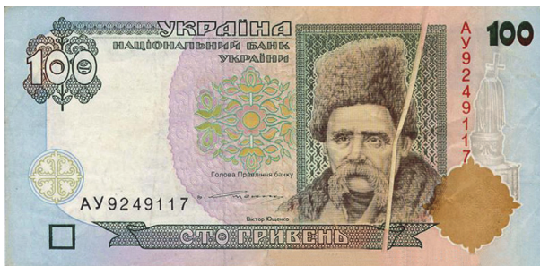
Рис. 4. Загальний вигляд лицьового боку банкноти номіналом 100 гривень зразка 1996 року зі складкою паперу