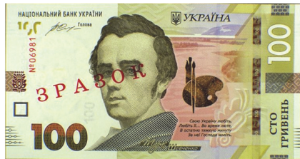
Рис. 8. Загальний вигляд лицьового боку банкноти-зразка номіналом 100 гривень зразка 2014 року

Третю групу складають дефекти, які утворюються під час нанесення на банкноти серійних номерів. До них відносяться відсутність серійних номерів, розташування номерів зі здвигом від встановлених ділянок (Рис. 9), друк номерів на невідповідному боці банкноти, перевернуті номери відносно основних зображень на банкноті.