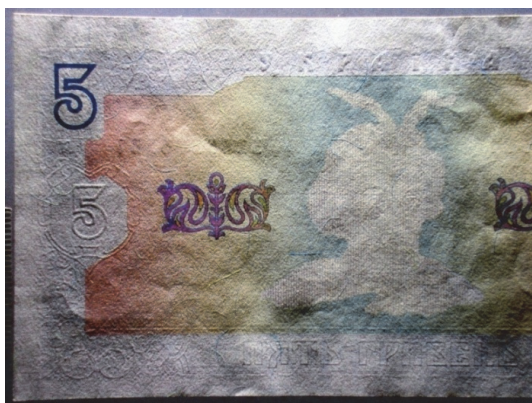
Рис. 3. Збільшений фрагмент лицьового боку цієї банкноти (зйомка у кососпрямованому світлі)