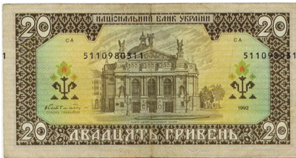
Рис. 9. Зворотний бік банкноти номіналом 20 гривень зразка 1992 року, на якій спостерігається здвиг номерів

Третю групу складають дефекти, які утворюються під час нанесення на банкноти серійних номерів. До них відносяться відсутність серійних номерів, розташування номерів зі здвигом від встановлених ділянок (Рис. 9), друк номерів на невідповідному боці банкноти, перевернуті номери відносно основних зображень на банкноті.