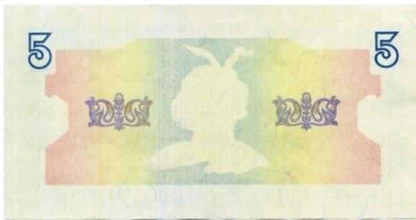
Рис. 2. Загальний вигляд лицьового боку банкноти номіналом 5 гривень зразка 1992 року з дефектом виробника (відсутні офарбовані зображення, що наносилися способом металографського друку фарбою синього кольору)