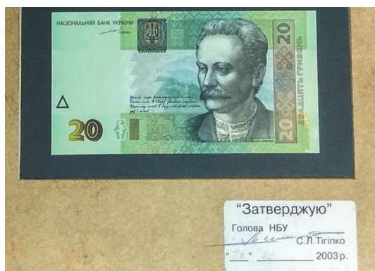
Рис. 1. Підписний аркуш із зображенням лицьового боку банкноти номіналом 20 гривень, затверджений Головою НБУ Сергієм Тігіпко

До початку друкування проводяться підготовчі роботи: розробляється технологічна документація, де відмічені особливості кожного етапу друкування; здійснюється монтаж та приладка друкарських форм. Попередньо, фахівці виробничо-технологічної лабораторії здійснюють підбір фарб за кольорами для відтворення на друкарському відбитку кольорової гами затвердженого кромалінового зразка банкноти. Цехом фарб, згідно розроблених лабораторією рецептур, виготовляються фарби для друкування тиражу. Виготовлений підписний аркуш, після його затвердження Головою Національного банку, слугує еталоном для друкування (Рис. 1).