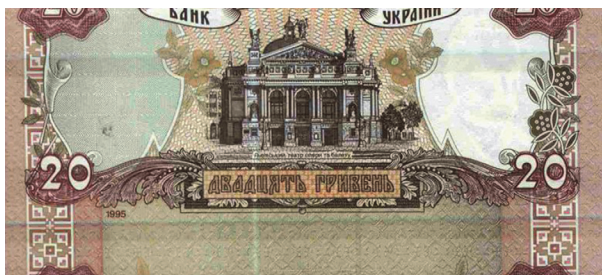
Рис. 10. Зворотний бік банкноти номіналом 20 гривень зразка 1995 року, яка розрізана зі зміщенням від країв по горизонталі

Четверту групу утворюють банкноти, на яких дефекти утворилися на завершальній стадії під час розрізування задрукованих аркушів (Рис. 10).