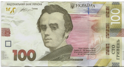
Рис. 7. Загальний вигляд лицьового боку банкноти номіналом 100 гривень зразка 2014 року, на якій відсутнє зображення палітри живописця