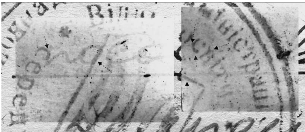
Рис. 3. Збільшене зображення фрагмента досліджуваного запису і відбитка печатки та їх відкопійованих фрагментів з подальшим накладанням за допомогою комп'ютерної графічної програми

На завершення слід зазначити, що слідчий або суд зазвичай виносять на вирішення експертизи загальне питання щодо внесення змін до первинного змісту документа без конкретної вказівки на той чи інший запис або реквізит, що ускладнює вирішення завдання. Тому експерту в таких випадках слід не тільки застосовувати весь арсенал методів і знань, а й проявляти експертну ініціативу, що сприятиме всебічному дослідженню та встановленню об'єктивної істини у справі.