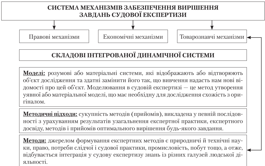
Рис. 2. Механізм забезпечення вирішення завдань судової експертизи