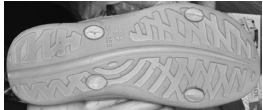
Рис. 5. Малюнок підшови взуття псевдопотерпілої

Проведені згодом судові експертизи дозволили дійти таких висновків: