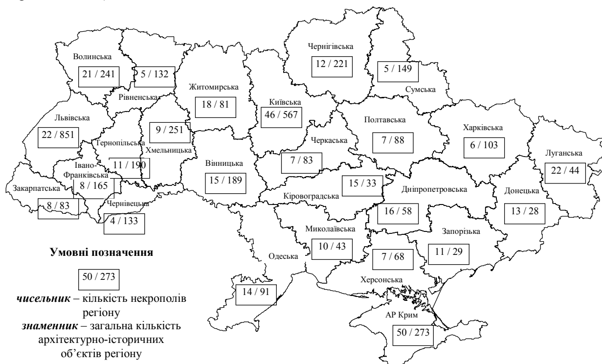
Рис. 2. Частка некрополів у загальній кількості архітектурно-історичних ресурсів регіонів України

Найменша частка некрополів припадає на ісламську складову – 5 одиниць (всі – в Криму). Це історично пояснюється зосередженням мусульманських громад переважно в Бахчисараї (гробниця «Дюрбе Діляри Бикеч», 1764 р. – Ханський палац, гробниці «Дюрбе Великий восьмигранник» XVI ст. і «Дюрбе Малий восьмигранник» XV–XVI ст. – с. Підгородне, гробниці «Дюрбе Кубоподібне» і «Мембер», гробниця «Старовинне Дюрбе» XIV ст.).