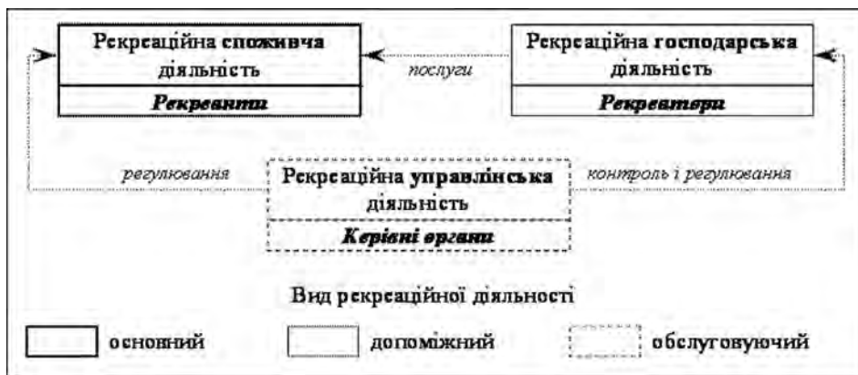
Рис. 2. Диференціація та зв'язок видів рекреаційної діяльності (складено автором)

На позначення активності рекреантів, рекреаторів та керівних органів у рекреаційній сфері розрізняємо такі види рекреаційної діяльності – споживча, господарська, управлінська. Якщо ці види діяльності диференціювати за значенням для виконання ТРС своєї основної функції – відновлення та розвиток будь-яких життєвих сил людини, то рекреаційна споживча діяльність буде основною, бо забезпечує головний результат здійснення рекреації, створює рекреаційний ефект; рекреаційна господарська діяльність – допоміжною, адже послуги, які надають рекреатори, доповнюють заняття рекреантів, допомагають їх реалізувати; рекреаційна управлінська діяльність – обслуговуючою, через те, що керівні органи, хоча і на різних ієрархічних рівнях (державному, регіональному, локальному), забезпечують лише регуляторно-контрольний аспект її здійснення. Незважаючи на таку диференціацію, кожен вид рекреаційної діяльності в межах ТРС надзвичайно важливий, бо здійснює взаємодію з іншими складовими системи, без чого неможливе її функціонування в цілому (рис. 2).