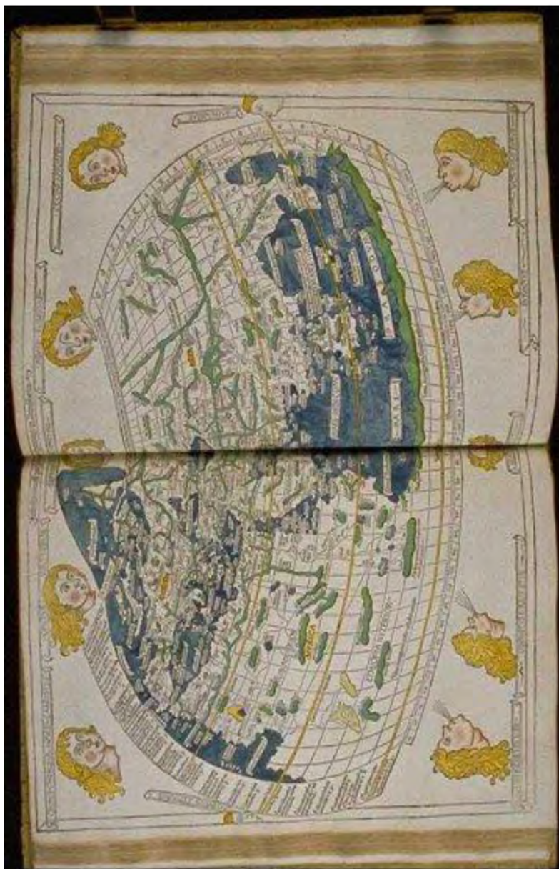
Рис. 1. Карта Півночі, складена Птоломесєм (III ст. н.е.) – фрагмент [9]