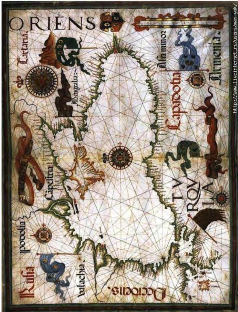
Рис. 3. Карта із Морського атласу 1559 р. Діогу Хемема [9]

(portolani)" [2], хоча це не зовсім точно: портолани власне були керівництвами для плавання між портами, на зразок старовинних периплів або сучасних лоцій, які супроводжували морські карти, але нерідко ця назва застосовується і до самих карт, що надавали найбільш необхідні та повні керівництва. Інша назва, що застосовується для них, це компасні карти, оскільки їх поява приблизно співпадає з розповсюдженням між італійськими моряками знайомства з компасом, і оскільки вони завжди мають характерну мережу, не з меридіанів та паралелей, як наші карти, а з ліній, відповідних румбам компасу, які розходяться (зазвичай у