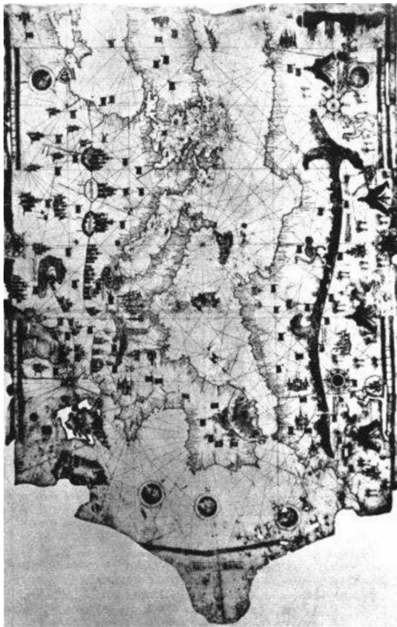
Рис. 2. Портолан Ігуди Юн Бен Зари Александрії (1487 р.) [9]