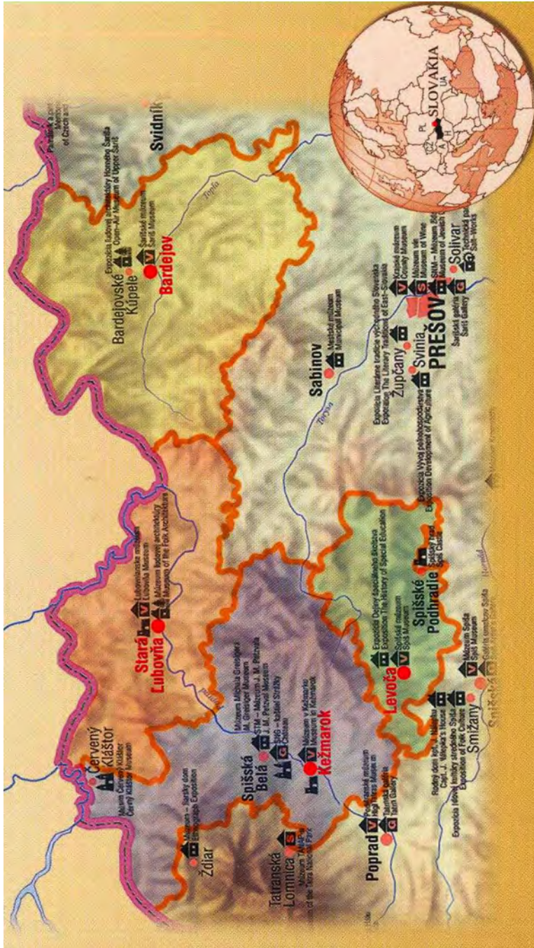
Рис. 2. Розміщення міст, що утворили консорціум «Словацькі королівські міста» [7]