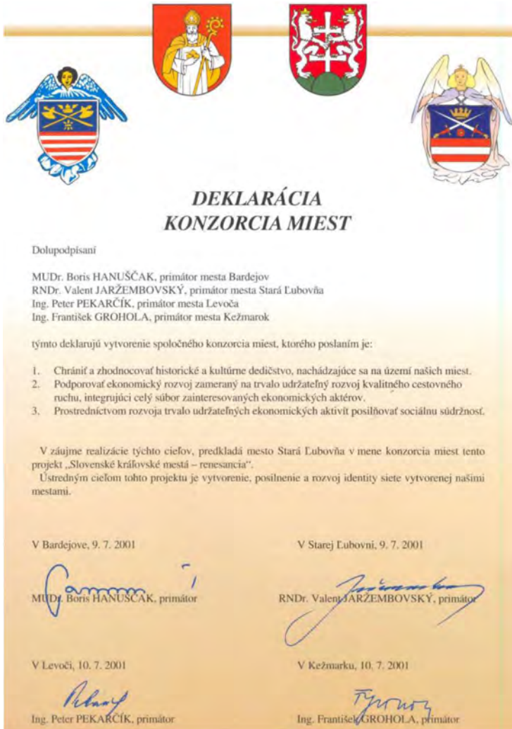
Рис. 1. Декларация про утворення Консорціуму «Словацькі королівські міста» (словацькою мовою) [7]

такими цілями: 1. Зберігати та відновлювати спільну історико-архітектурну та культурну спадщину, що знаходиться на території міст-учасників. 2. Сприяти господарському поступу міст-учасників насамперед через розвиток сучасних високоякісних форм туризму, що мають інтегрувати всі причетні економічні складники. 3. Шляхом