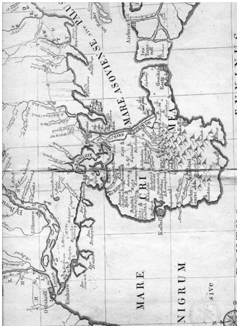
Рис. 1 Фрагмент карти “Teatrum belli anno MDCCXXXVII a milite augustae russorum imperatricis adversus Turcas Tattarosque gesti”