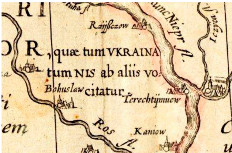
Рис. 2. Фрагмент карти Великого Литовського князівства 1613 р.

позначенням місця розташування Запорізької Січі – тоді це була Січ на Томаківці. Пізніше спеціальне креслення течії Дніпра від Черкас до гирла, тобто тієї частини річки, яка не вмістилась на загальній карті, друкувалось в атласах окремо від карти Литви.