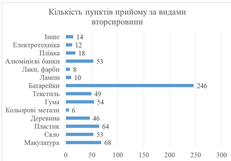
Рис.1. Кількість пунктів прийому вторсировини у м.Київ

пункти екологічного проекту «Батарейки, здавайтеся!»; 2) пункти мережі «Київміськвторресурс» та 3) інші компанії та приватні підприємства, що займаються прийомом вторсировини. Про кожен об'єкт можна переглянути таку інформацію: адреса, назва компанії, години роботи, контакти, веб-сайт, вторсировина що приймається та ціна на неї. Також завдяки шару «Райони Києва» можна визначити які пункти розташовані в окремому районі (рис. 3).