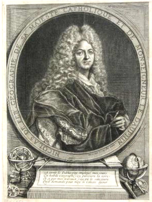
Рис. 1. Портрет Ніколя де Фера у виконанні Й. Бенара (J. Benard)

і видавцем свого часу: він створював плани міст, настінні карти, випустив понад 600 географічних карт, багато з яких були систематизовані в атласах. Особливу увагу картограф зосередив на створенні карт театрів воєнних дій (зокрема, війни за іспанський спадок), планів та описів європейських міст та їх укріплень, французьких провінцій, морських шляхів.