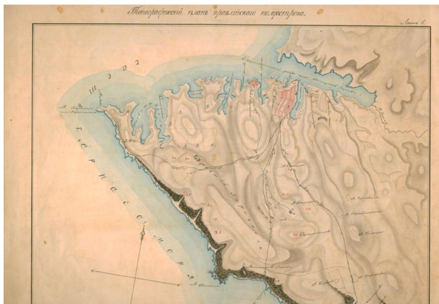
Рис. 2. З. А. Аркас. Топографічний план Гераклійського півострова, 1848 р.

розкопок Херсонесу з показанням робіт, проведених в 1876 р. [34], в 1876 – 1878 рр. [35] (з рисунками відкритих капітелей) в 1878 – 1881 рр. [36] та в 1885 р. [37].