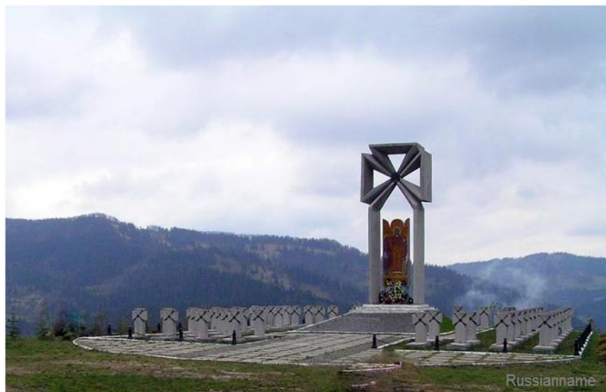
Рис. 3. Меморіал-некрополь УСС на горі Маківка [8]