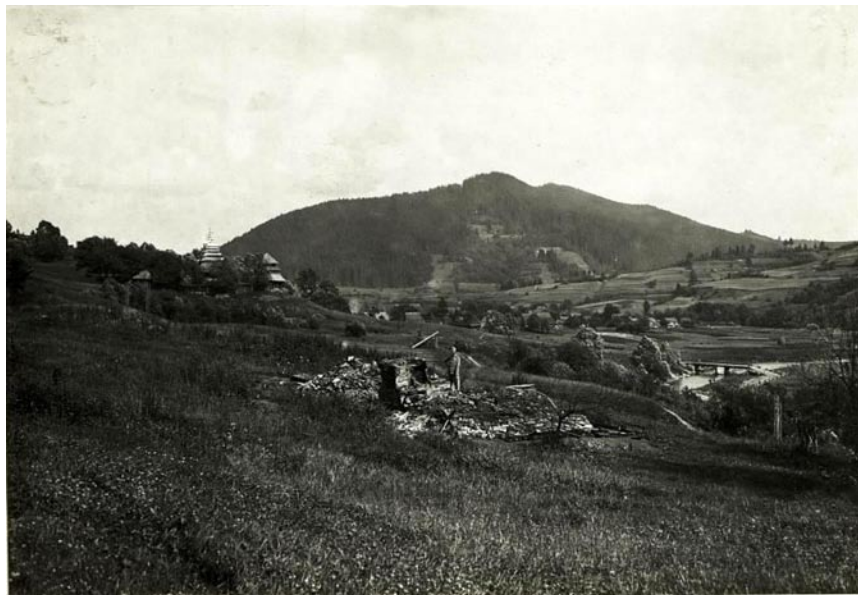
Рис. 2. Гора Маківка. Загальний вид [8]