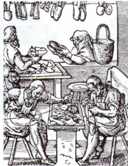
Майстерня епохи пізньої готики з виготовлення пантофлів та дерев'яних черевиків (Жост Амман. Взуттєвник. Різьба по дереву)

Під словом «взуття» мають на увазі всі його види, форму-основу яких становить підошва, що покриває усю ступню й захищає ногу від шкідливих зовнішніх впливів. З античних часів відомі сандалії з шнурівкою, які використовували в повсякденному носінні аж до епохи середньовіччя. Дотепер на Балканському півострові носять «опанки», дуже схожі на ці сандалії.