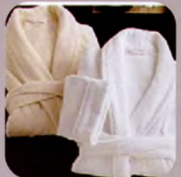
Чоловічий та жіночий асортимент