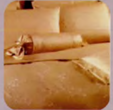
Матраци, подушки, та намотрацники