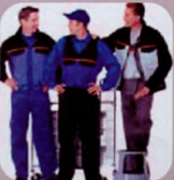
Спецодяг, робочий одяг