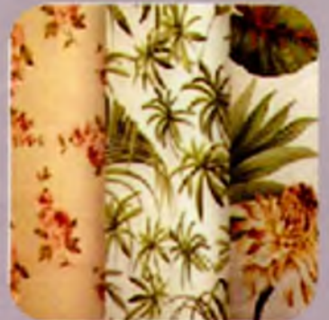
Тканини, нитки та пряжа