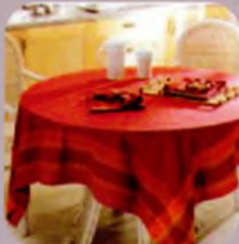
Текстиль для кухні