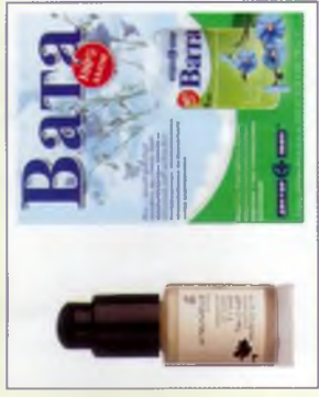
Косметичні й лікарські препарати