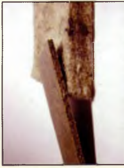
Конструкційні та ізоляційні матеріали