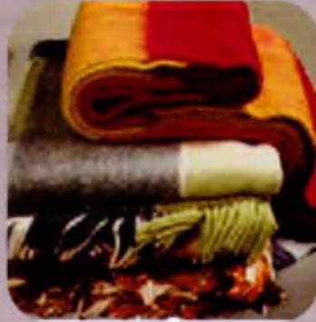
Пледи, покривала, ковдри суконні та стьобані