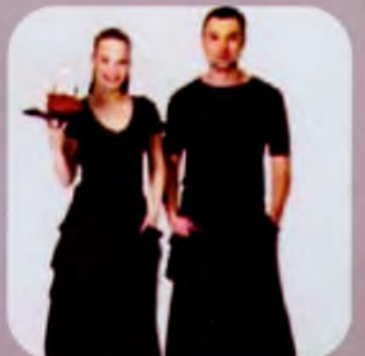
Уніформа та аксесуари