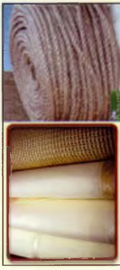
Текстиль та кручені вироби