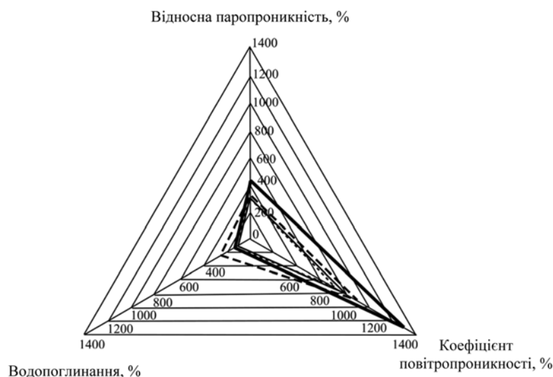
Рис. 1 – Діаграма показників «дихальної активності» утеплювачів:

Значення рекомендованих показників становлять: для коефіцієнта повітропроникності – 100 дм 3 /(м 2 ·с), відносної паропроникності – 30%, водопоглинання – 120%.