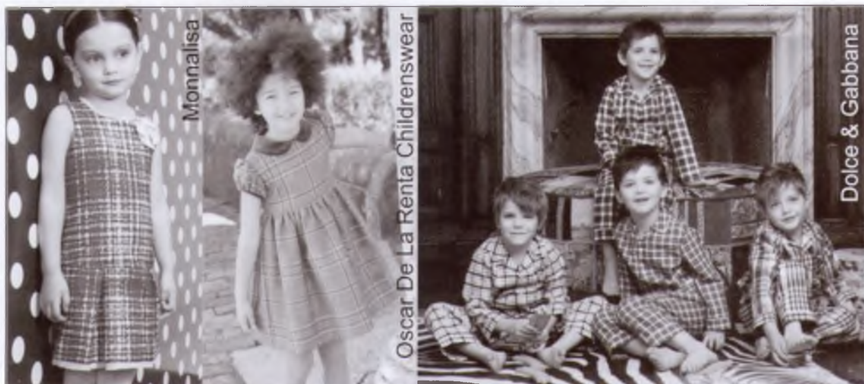
Рис. 6 – Моделі дитячого одягу з картої тканини