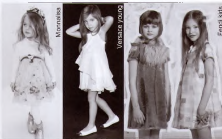
Рис. 4 – Моделі святкового дитячого одягу

Матеріал костюма для хлопчика має однотонне забарвлення та фактуру для усіх виробів. Найчастіше в колекціях дизайнерів зустрічаються класичні піджаки різних відтінків сірого кольору, рідше – чорного. Популярними є картаті піджаки. Святкові сорочки прикрашають різноманітним оздобленням, а також доповнюють краваткою, краваткою-метелик або шийною хусткою (все майже як у дорослих чоловіків).