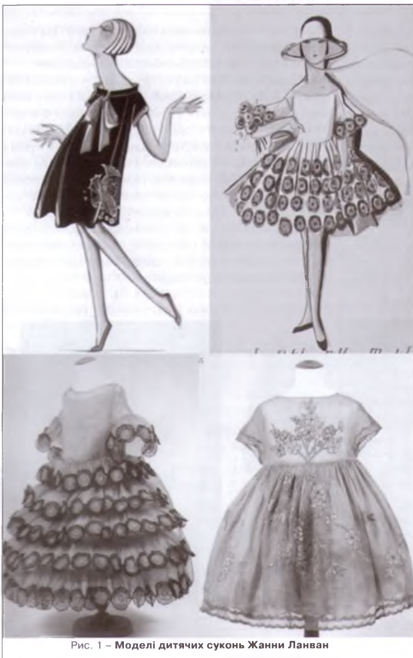
Рис. 1 – Моделі дитячих суконь Жанни Ланван

Стиль «ретро» в сучасних колекціях для дітей помічено у колекціях Монналіза, Ланван петіт, Дольче і Габбана тощо. Для дівчаток дизайнери пропонують сукні, шорти, пальта, футболки тощо, для хлопчиків – штани, фуфайки, сорочки, светри, пальта (рис. 2).