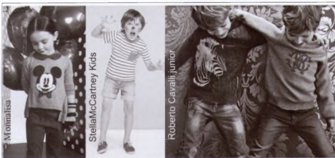
Рис. 5 – Моделі дитячого одягу для дому

Домашній одяг зазвичай прямого силуету, без зайвих членувань. Зручність – основна вимога, тому щільний чи навпаки дуже вільний одяг є неприйнятний. Необхідним конструктивно-декоративним елементом є кишені, а інколи – капюшон.