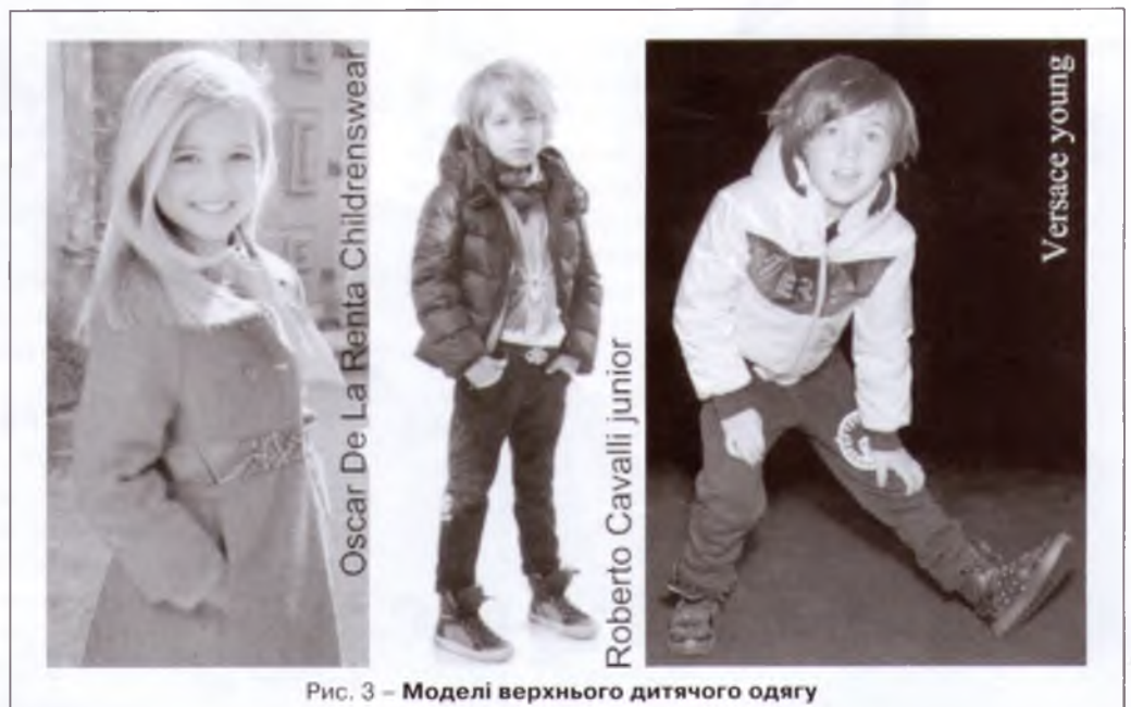
Рис. 3 – Моделі верхнього дитячого одягу

Варто відзначити, що для моделей даної групи використовують такі матеріали: кашемір, твід, плащові тканини, трикотаж, шкіру, тканини з досить вираженою фактурою тощо.