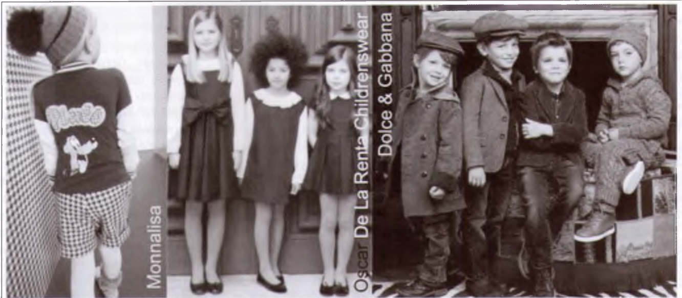
Рис. 2 – Моделі дитячого одягу в стилі «ретро»

У колекції Монналіза риси стилю «ретро» підкреслено завдяки використанню зображення Плуто (анімаційний персонаж у мультфільмах Уолта Діснея, 1930-1950 рр.) і тканин з рисунком «гусяча лапка». Для суконь характерними є силуети прямий та трапеція. Для піджаків та пальт в стилі «ретро» модною є двобортна застібка на шість або вісім ґудзиків.