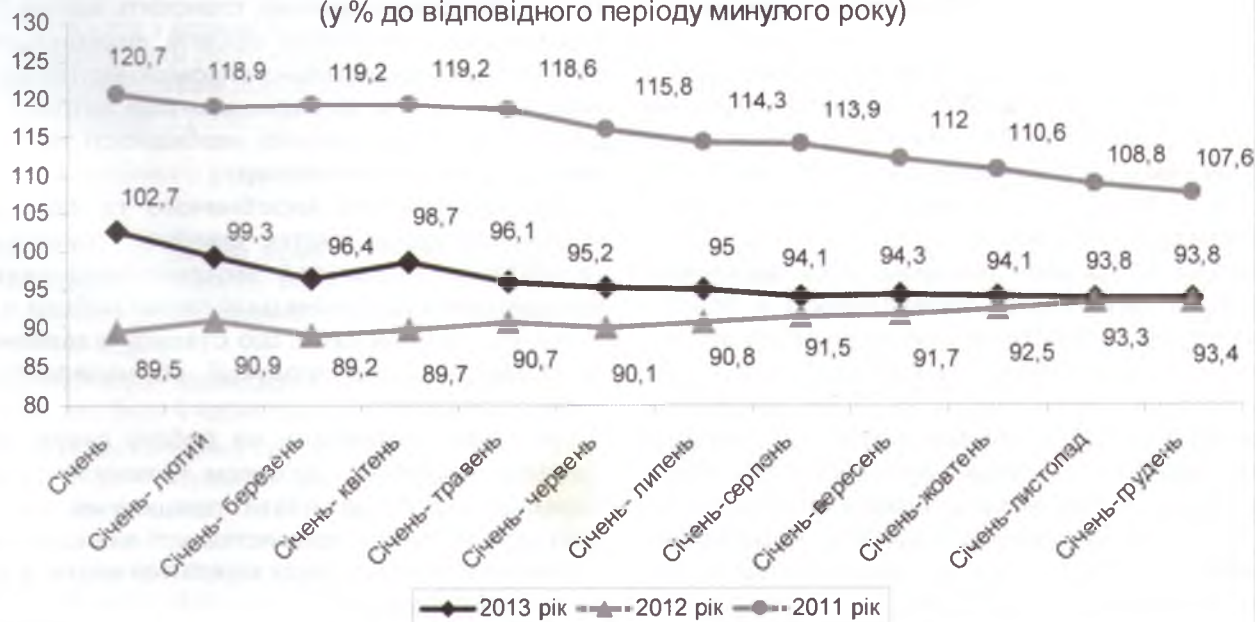
Динаміка індексів текстильного виробництва, виробництва одягу, шкіри, виробів зі шкіри та інших матеріалів (у % до відповідного періоду минулого року)

За даними статистики, в січні-листопаді 2013 р. реалізовано товарів легкої промисловості на суму 7279,0 млн. грн., що становить всього 0,7% від всієї реалізованої продукції в промисловості. Індекс обороту (реалізації) продукції текстильного виробництва, виробництва одягу, шкіри, виробів зі шкіри та інших матеріалів за листопад 2013 р. до жовтня 2013 р. становив 92,7%, а до листопада 2012 р. – 95,7%.