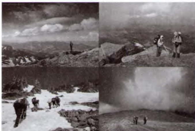
Рис. 1 – Екстремальний туризм за різних природних умов

Приклади сучасних екстремальних туристичних походів за різних природних умов подано на рис.1.