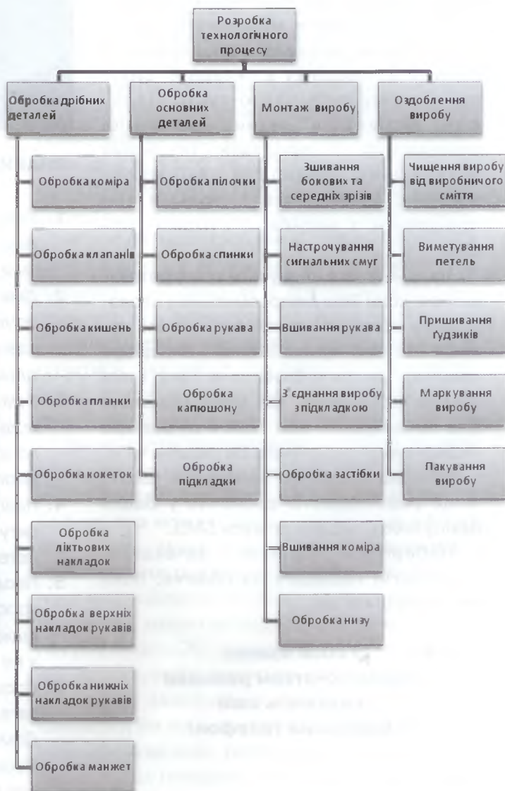
Рис. 2 – Технологічна схема виготовлення куртки для екстремального туризму

На рис. 2 – технологічна схема виготовлення куртки для екстремального туризму.