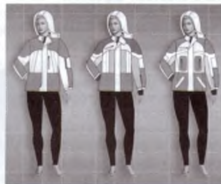
Рис. 4 – Ескізи курток для екстремального туризму

Рисунки розроблених ескізів моделей (рис. 4) виконано в автоматизованому режимі із застосуванням графічного редактора Xara Xtreme Pro 5.