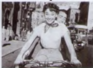
1. Римські канікули (1953)