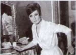
5. Як вкрати мільйон (1966)

Зіркові партнери Одрі не приховували свого захоплення нею. Природно, пішов поголос про службові романи. Проте вона уміла рішуче і красиво відмовляти, якщо розуміла, що їй з тією людиною не по дорозі. Їй залишатися при цьому добрими друзями!