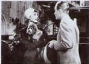
2. Сабріна (1954)