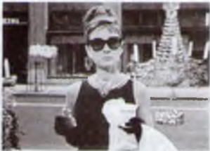
3. Сніданок у Тіффані (1961)