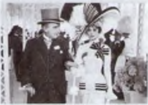
4. Моя чудова леді (1964)