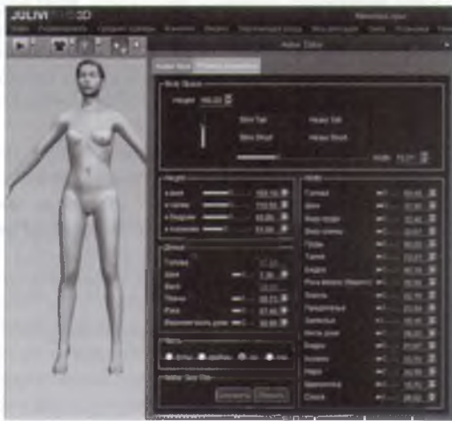
Рис. 3 – Вікно задання параметрів манекена