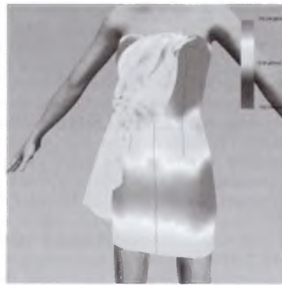
Рис. 5 – «Карта напруження», яка показує ступінь тиску виробу на манекен

Ця інформація є аналогічною тій, яку можна мати внаслідок примірки швейного виробу, проте є істотні переваги завдяки економії матеріалів на виготовлення експериментального зразка, часу на його розкрояння і пошиття.