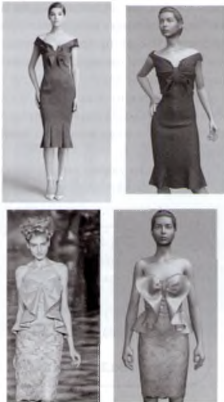
Рис. 1 – Моделі одягу та їхні тривимірні віртуальні копії

Виріб одягають на манекен аналогічно тому, як це відбувається в реальності: лекала шивають в програмі по швах, послідовність шивання задає конструктор. Для цього використовують лекала, заздалегідь розроблені в програмі «Конструктор» САПР JULIVI. Ці два модулі взаємопов'язані між собою, і всі зміни, внесені в лекала, моментально відображаються в віртуальній моделі.