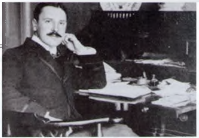
Уільям Сомерсет МОЕМ (1874–1965)