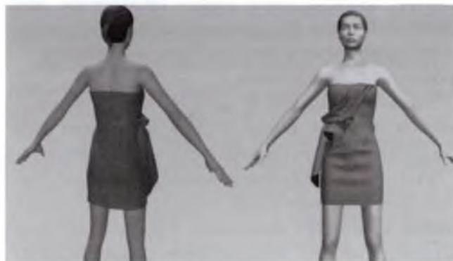
Рис. 2 – Виріб, одягнений на тривимірний манекен жіночої фігури, в різних ракурсах

Манекен характеризується високим ступенем реалістичності. Готову модель можна розглянути в різних ракурсах, «покрутивши» правою клавішею миші (рис. 2).