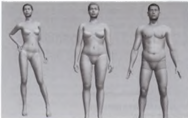
Рис. 4 – Манекени програми JULIVI CLO3D: жіночий манекен в позі; манекен жіночої фігури 164-104-108; манекен чоловічої фігури