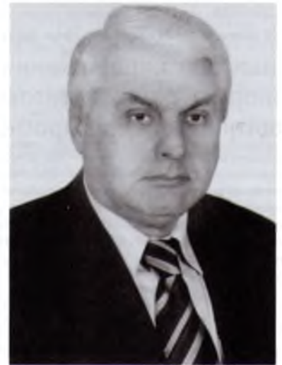
Президент УТА, Ігор Іванович ПОЛОВНИКОВ, професор, д-р техн. наук, Заслужений діяч науки і техніки України

В Україні у третю суботу травня щорічно відзначають професійне свято працівників науки – День науки, встановлений Указом Президента № 145/97 від 14 лютого 1997р.