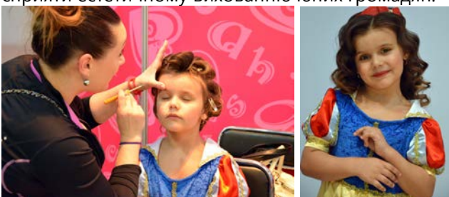
Рис. 4. Створення дитячого образу

Дитяча зачіска повинна бути красивою і зручною, вона повинна прикрашати дитину і приносити їй радість, сприяти правильному фізіологічному розвитку дитячого організму, сприяти естетичному вихованню юних громадян.