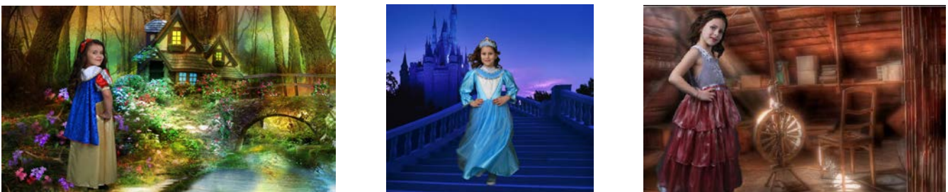
Рис.3. Постпродакшн створення дитячого образу

Процес моделювання дитячих зачісок складається з тих самих етапів, що і процес моделювання зачісок для дорослих, але ця область моделювання містить деякі обмеження або доповнення, викликані суворими вимогами, які базуються на особливостях віку і психології дитини. Під час моделювання зачісок для дітей необхідно враховувати особливості статури і психологію дитини в різні періоди її росту, вимоги гігієни та педагогіки [1, ст. 181].