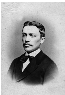
Іван Пулюй Відень, 1870 р.