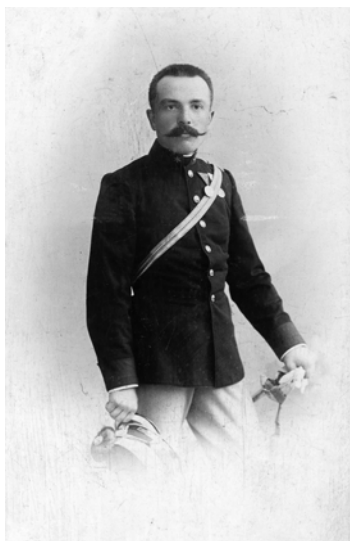
Володимир Левицький Львів, 1899 р.