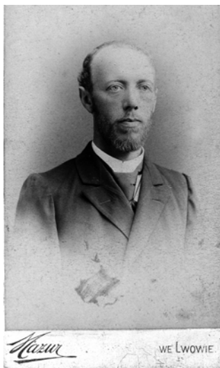
Петро Огоновський Львів, [1887–1905]