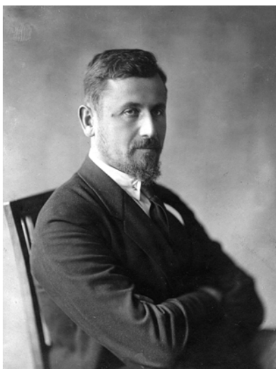
Михайло Кравчук Київ, б. р.