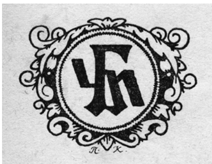
Емблема й видавнича марка ГДУМ. Автор П. Ковжун