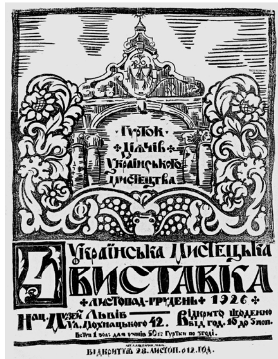
Афіша виставки ГДУМ. Автор В.Січинський