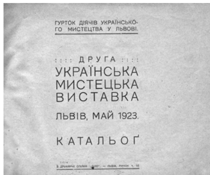
Каталоги виставок ГДУМ. Обкладинка (автор В.Січинський) й титульні сторінки першої та другої виставок