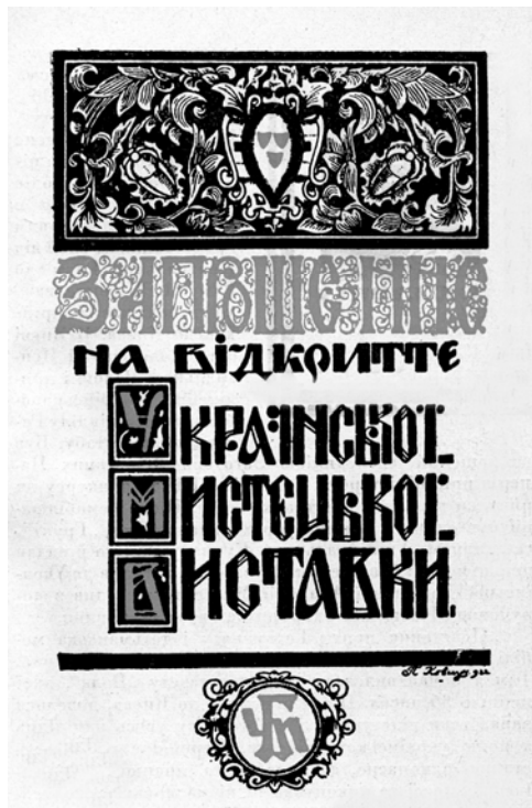
Запрошення на виставку ГДУМ. Автор П.Ковжун