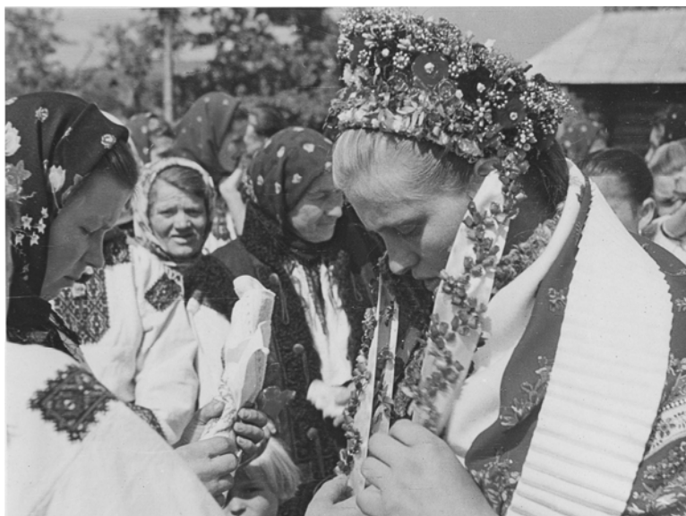
Весільне вбрання молодої. 11 серпня 1960 р., с. Вербовець