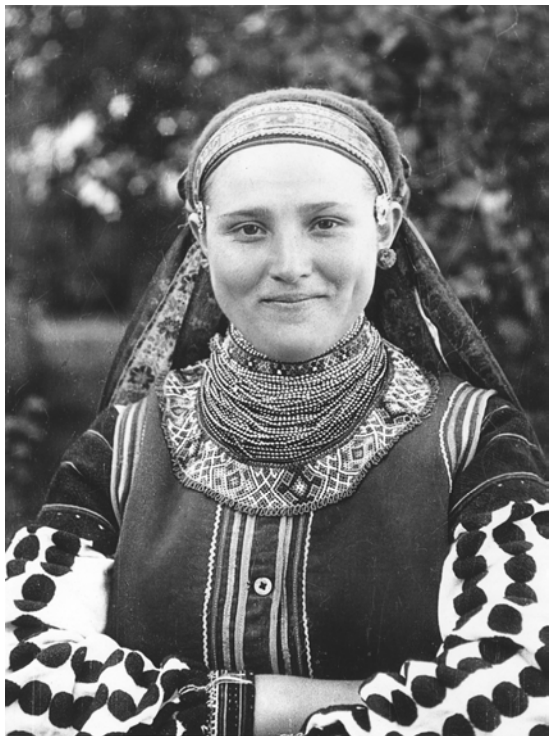
Дівчина-відданиця 15 вересня 1946 р., с. Ясенів-Пільний