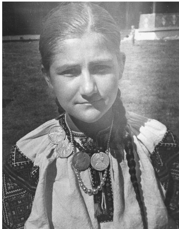
Дівчина з дукачами 12 липня 1971 р., Красноїля