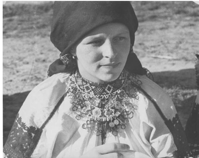
Молода в гердані Червень 1940 р., с. Лука