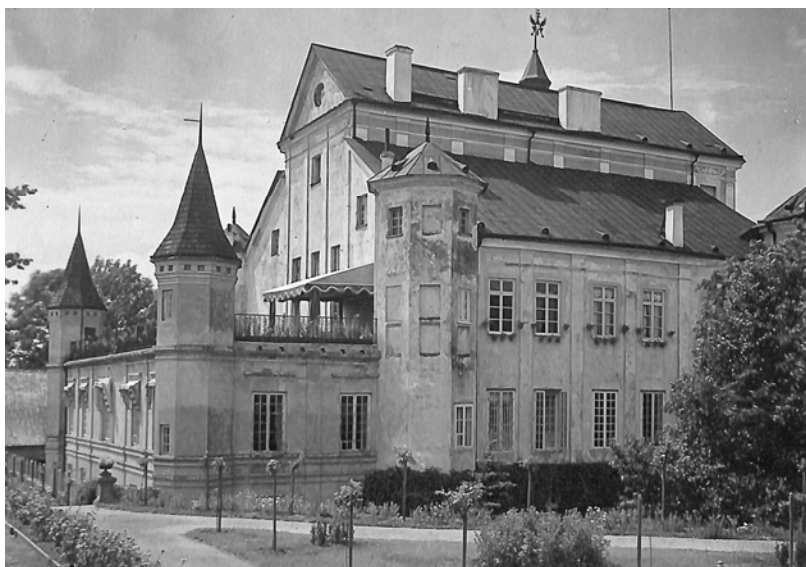
Ян Булгак. Палац Радзівілів. Несвіж (Білорусь), 1918 р.