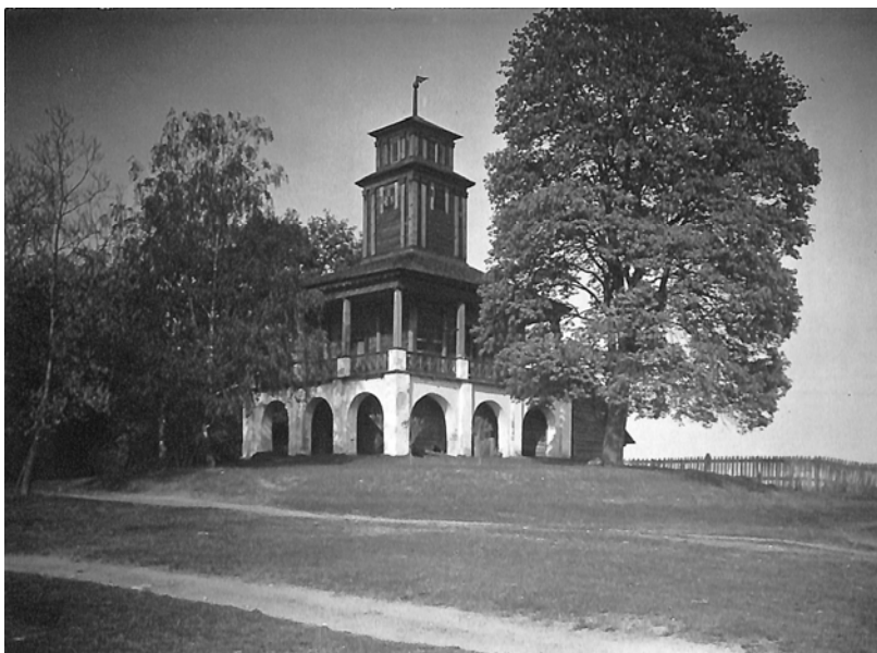
Ян Булгак. Шихлір. Раудондваріс (Червоний двір, Литва), 1917 р.