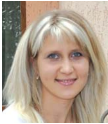
автор | Юлія Микитенко, аналітик ринку цукру