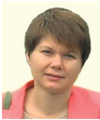
автор | Г. Немченко, економіст