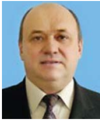
АВТОР | С. Дем'яненко, професор, доктор економічних наук, завідувач кафедри економіки агропромислових формувань ДВНЗ «Київський національний економічний університет ім. Вадима Гетьмана»