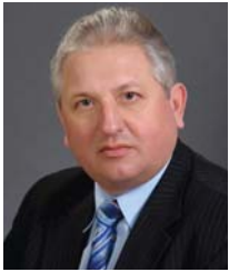
автор | Ю.О. Лупенко, д.е.н., академік НААН, директор Національного наукового центру «Інститут аграрної економіки»