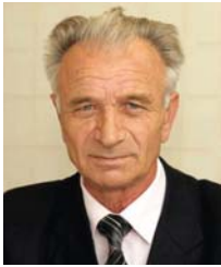
автор | М.Ф. Кропивко, д.е.н., професор, академік НААН, завідувач відділу проблем галузевого і територіального управління Національного наукового центру «Інститут аграрної економіки»