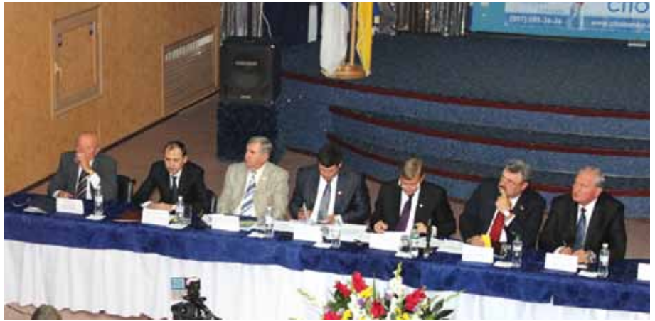
З'їзд Української асоціації районних та обласних рад, Одеська область, 11.09.2012 р.

Асоціацією також підписано низку договорів про співпрацю з міжнародними організаціями, серед них: Угода з Програмою розвитку Організації Об'єднаних Націй, Меморандум про взаєморозуміння з Канадським інститутом урбаністики про виконання