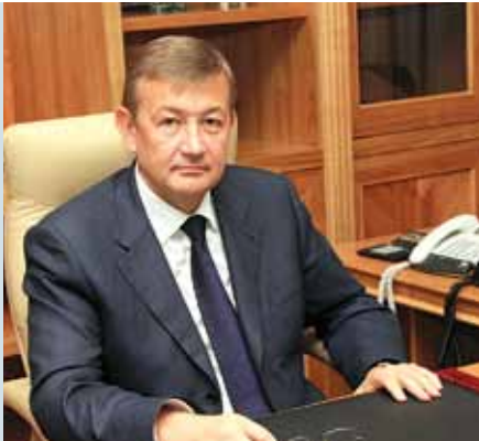
Сергій ЧЕРНОВ, президент Української асоціації районних та обласних рад, голова Харківської обласної ради, кандидат наук з державного управління

Цього року Всеукраїнська асоціація органів місцевого самоврядування — Українська асоціація районних та обласних рад — відзначила двадцять років свого існування.