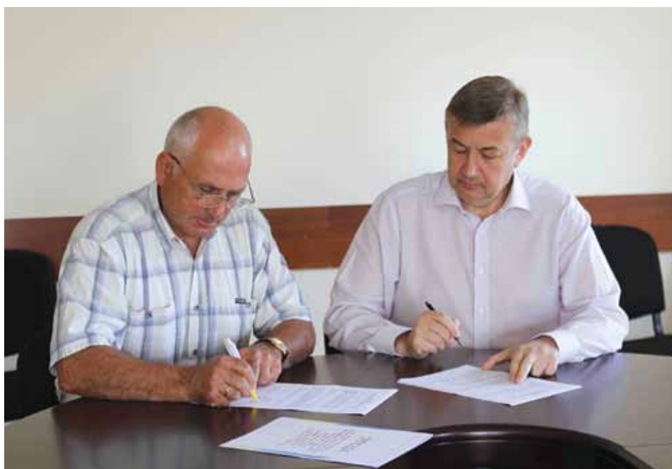
Підписання угоди про співпрацю