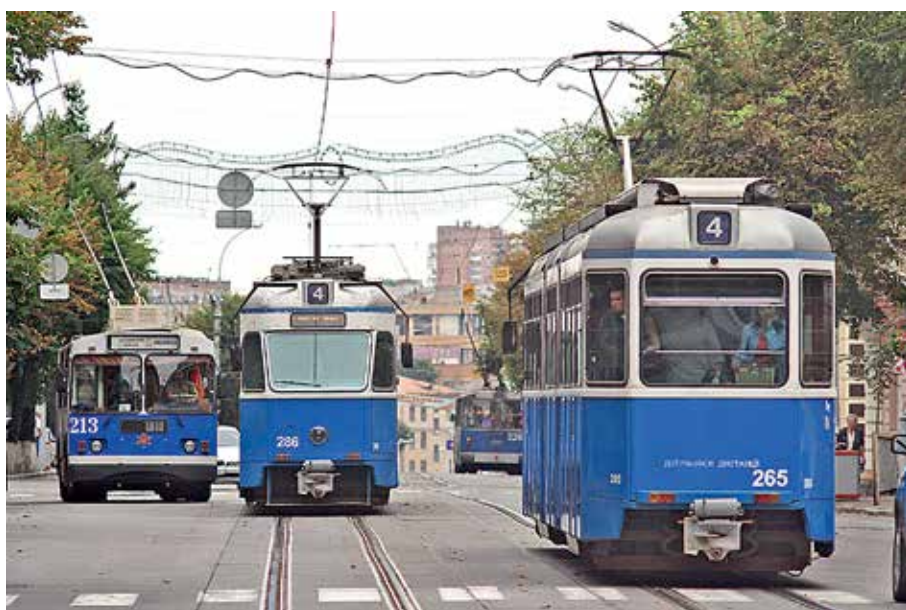
Швейцарські трамваї у м. Вінниця

Загалом, сучасна Вінниця розвивається, шукаючи відповіді на виклики часу у кожній сфері свого життя. Головне завдання влади – зробити Вінницю сучасним, комфортним європейським містом, а міжнародна співпраця та досвід, без сумніву, допомагає у цьому.