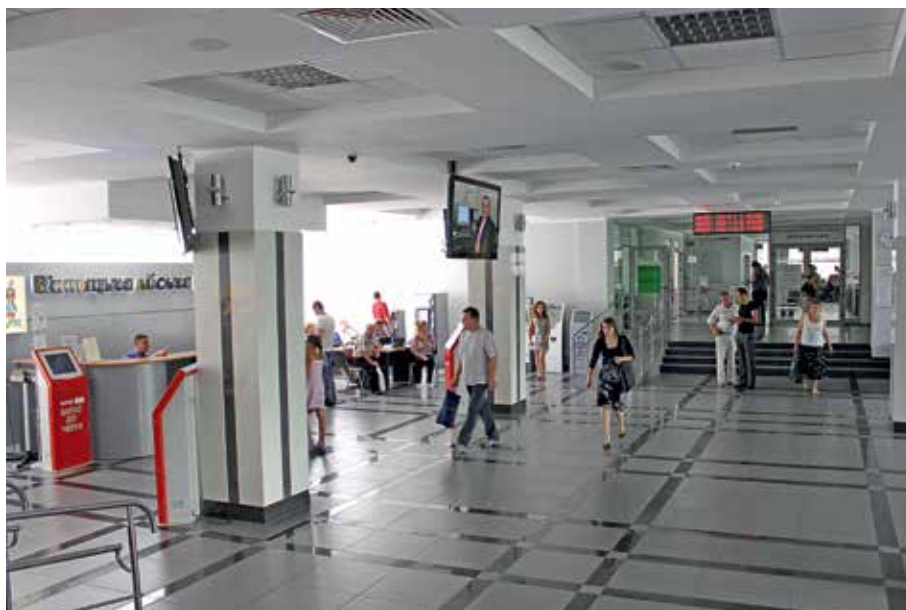
Центр адміністративних і соціальних послуг «Прозорий офіс» (1-й поверх Вінницької міської ради)

Для вінницької влади досить важливо не лише розуміти і бачити проблеми територіальної громади, усвідомлювати причини їх виникнення, залучати додаткові ресурси, а й шукати ефективні шляхи їх вирішення. Адже не завжди наявність достатньої кількості фінансового ресурсу дозволяє досягати якісних результатів. Тому досить важливо обмінюватись досвідом та отримувати інформацію з різних джерел. У цьому питанні важлива методологічна підтримка закордонних партнерів, які володіють європейським досвідом і власним поглядом на вирішення різних проблем. В 2011 р. у Вінниці, спільно з Британською Радою, Швейцарським агентством розвитку та співробітництва, швейцарсько-українським проектом «DESPRO», був підготовлений та проведений семінар «Розвиток міст Східної Європи» за участю молодих мерів з 14 міст Східної Європи та України. За результатами семінару була видана збірка матеріалів «Сучасні тенденції розвитку міст Східної Європи». Також Вінницька міська рада, спільно з Асоціацією «Енергоефективні міста України», організувала міжнародну конференцію «Менеджмент та фінансування сталого енергетичного розвитку міст». На конференції були присутні посол Фінляндії, науковий директор організації «Ifeu-Institut Heidelberg», представники Світового