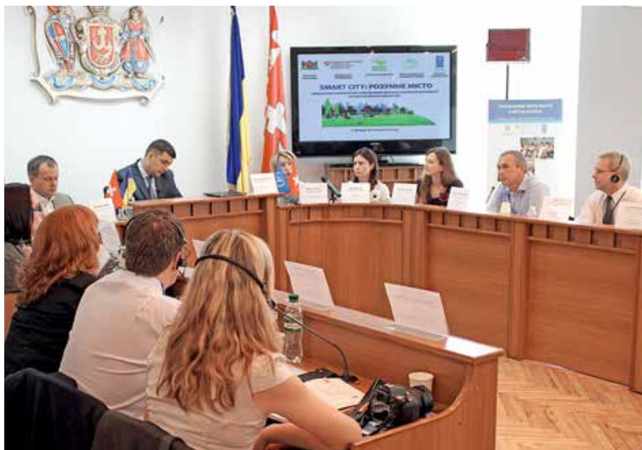
Конференція міст України за участю міжнародних експертів «SMART CITY, електронні технології для забезпечення розвитку локальної демократії та сталого міського розвитку», липень 2012 р.

Три роки тому (у 2010 році) Вінниця підписала угоду про партнерство з Програмою розвитку організації об'єднаних націй (ПРООН), яка передбачає надання підтримки мешканцям, малому бізнесу, громадським організаціям, закладам освіти та міській раді в напрямку розв'язання соціально-економічних та екологічних проблем на території міста. В рамках цього проекту передбачається, зокрема, підтримка створення та діяльності об'єднань співвласників багатоквартирних будинків. Цього ж року Вінниця увійшла до складу Асоціації «Енергоефективні міста України», яка діє в рамках Угоди мерів (проект Європейського союзу), а восени 2010 року подільська столиця приєдналась до європейської ініціативи «Угода мерів».