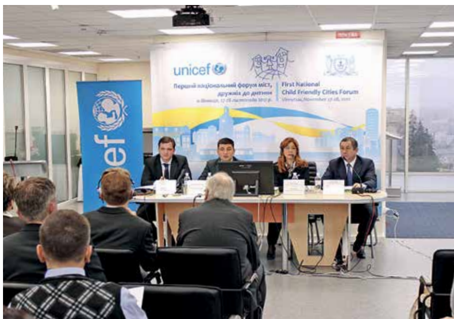
Перший національний форум міст, дружніх до дитини, листопад 2012 р.

банку, представники міжнародної організації «Climate Alliance», керівник Німецького товариства міжнародного співробітництва «GIZ», представники ЄС в Україні та мери українських міст, які входять до складу Асоціації «Енергоєфективні міста України». Також Вінницька міська рада, спільно з партнерською організацією UNEP (Женева), Франкфуртською школою фінансів та управління (Німеччина), муніципалітетами м. Бельці (Молдова) та Ічері Шехер (Азербайджан), виграла грант Європейської комісії «Підтримка участі країн Східного партнерства та міст Центральної Азії в Угоді Мерів». Метою 3-річного гранту є посилення місцевих органів влади та зацікавлених сторін щодо стійкого енергетичного планування (особливо у будівельному, транспортному та фінансовому секторах). В травні 2012 році у Вінниці відбулися перші робочі семінари та тренінги. Окрім семінарів та конференцій, працівників виконавчого апарату міської ради стажувались у Швейцарії і Польщі та, з метою вивчення позитивного досвіду сталого міського розвитку, відвідали Німеччину, Великобританію, Австрію, Боснію та Герцеговину, Македонію, Ізраїль.