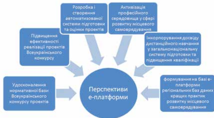
Мал. 2. Перспективи е-навчання

Враховуючи набутий досвід та отримані знання, посадові особи органів місцевого самоврядування внесли пропозиції щодо запровадження постійно діючих курсів підвищення кваліфікації для державних службовців та представників органів місцевого самоврядування з питань підготовки та написання проєктів у рамках Всеукраїнського конкурсу проєктів та програм розвитку місцевого самоврядування. Зазначені пропозиції враховані під час внесення змін до постанови Кабінету Міністрів України від 18 травня 2003 року «Про затвердження положення про Всеукраїнський конкурс проєктів та програм розвитку місцевого самоврядування».