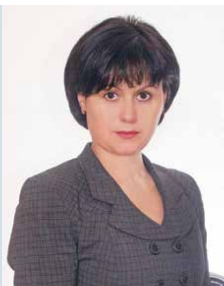
Олена ТЕРИШНА, перший заступник голови Державного фонду сприяння місцевому самоврядуванню в Україні, кандидат наук з державного управління

С учасний стан професійного навчання посадових осіб місцевого самоврядування свідчить, що діюча система носить скоріше інформаційний або академічний характер і меншою мірою характеризується динамічністю та практичною цілеспрямованістю щодо здобуття певних навичок, необхідних для виконання посадових обов'язків.