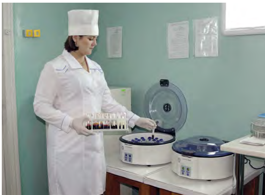
Клініко-діагностична лабораторія центральної районної лікарні