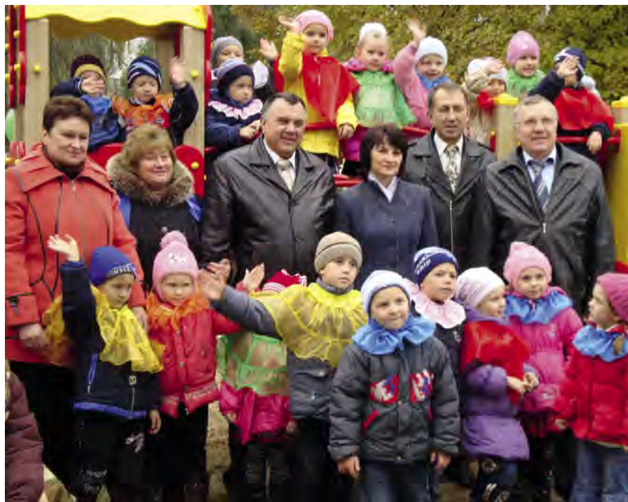
Відкриття спортивно-ігрового майданчика у с. Привовчанське, Дніпропетровської області

З метою ефективного використання потенціалу громад необхідно навчитись організовуватися, визначати дійсних лідерів, пріоритетні проблеми громади, технічну спроможність вибраних засобів, формувати партнерські стосунки між владою, громадськістю та підприємницькими колами, бо запровадження сталого розвитку неможливе без формування соціального партнерства.