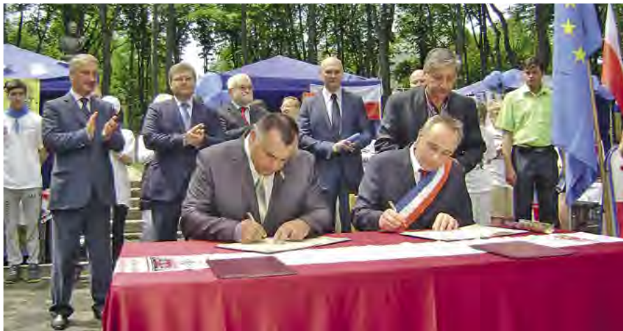
Підписання угоди про співпрацю між Павлоградським районом Дніпропетровської області та комуною Рошфор-сюр-Кот (Франція)

них семінарах щодо розробки пропозицій та участі у Швейцарсько-Українському проекті «Підтримка децентралізації в Україні» (DESPRO);