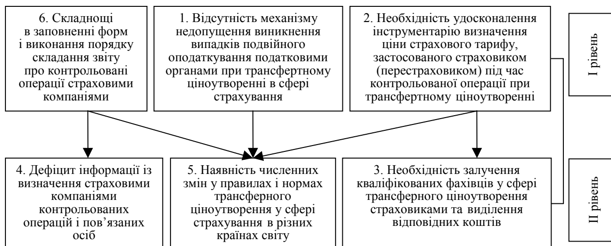
Рис. 2. Ієрархічна модель проблем, пов'язаних із необхідністю вдосконалення регулювання трансфертного ціноутворення в сфері страхування

На підставі табл. 5 і 6 побудовано їх ієрархічну модель (рис. 2.1), що дало змогу визначити базові суперечності, які виникають у процесі запровадження й реалізації трансфертного ціноутворення в сфері страхування.