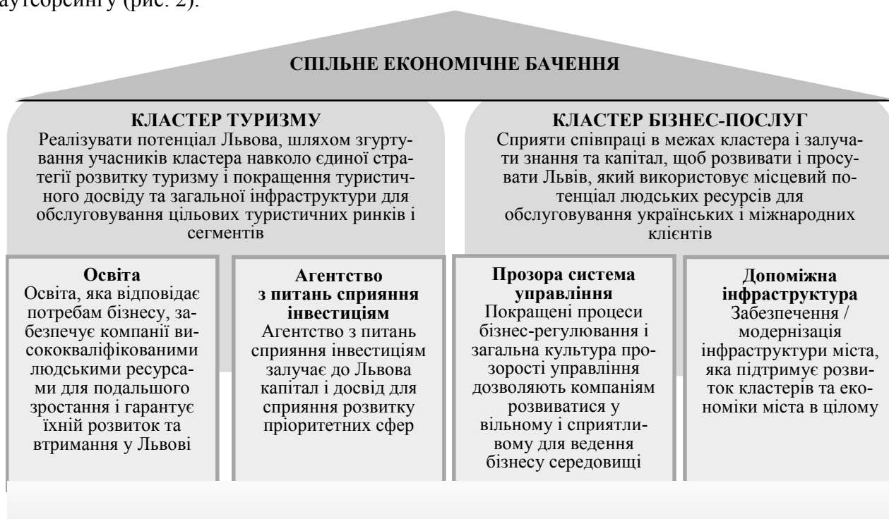
Рис. 2. Стратегія підвищення конкурентоспроможності економіки міста Львова

Кластер «Туризм» у Львові може розвиватися на основі наявних активів, але його потрібно модернізувати і сфокусувати так, щоб охопити оптимальний туристичний сегмент. Бізнес-послуги допоможуть місту повною мірою використати існуючий потенціал людських ресурсів позиціонувати себе як бізнес-центр, конкурентний на міжнародному рівні, з потенціалом аутсорсингу (рис. 2).