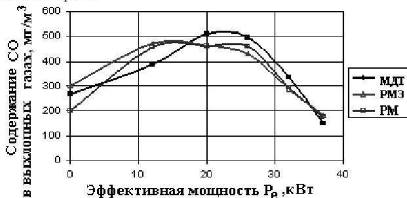
Рис. 3. Содержимое CO в выхлопных газах в зависимости от эффективной мощности P_e при работе двигателя на различных видах топлива ( n=1800 \text{ мин}^{-1} )

Данные о содержании окиси углерода (CO) в выхлопных газах дизельного двигателя в зависимости от его эффективной мощности показаны на рис.3