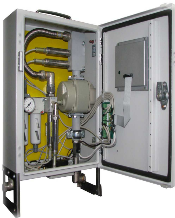
Рисунок 2 – Фотографія потокового густиноміра OE-RO2

тиску 1 і вихід трубопроводу середнього/низького тиску 2 споряджені штуцерами 19 і 20, відповідно, для під'єднання пристрою гнучкими шлангами до діючого трубопроводу на місці вимірювання.