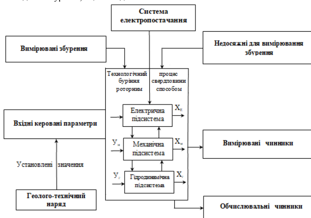
Рисунок 1 – Параметрична схема технологічного процесу буріння свердловин роторним способом

Окрему групу параметрів утворюють збурюючі впливи f(t) , які є недосяжними для вимірювання, до них відносяться: фізико-механічні властивості порід (контактна міцність, абразивність, пластичність та ін.), пружні сили, які діють на колону, повздовжні та поперечні коливання колони, сила тертя і т.д. [4].