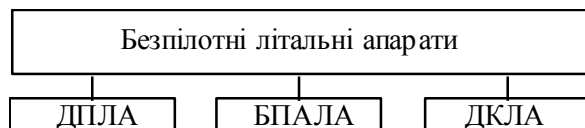
Рис. 2. Класифікація БПЛА за способами керування

Розрізняють дистанційно пілотований літальний апарат (ДПЛА) – безпілотний літальний апарат з управлінням, яке здійснюється із пункту управління, безпілотний автоматичний літальний апарат (БПАЛА) – безпілотний літальний апарат, що реалізовує своє функціональне призначення в автоматичному режимі відповідно до закладених у нього алгоритмів і програм функціонування та дистанційно керовані літальні апарати (ДКЛА). ДКЛА – безпілотні літальні апарати, що реалізують своє функціональне призначення переважно автономно, з епізодичним втручанням оператора управління для перепрограмування системи управління літальним апаратом. На рис. 2 подано класифікацію БПЛА за способами керування.