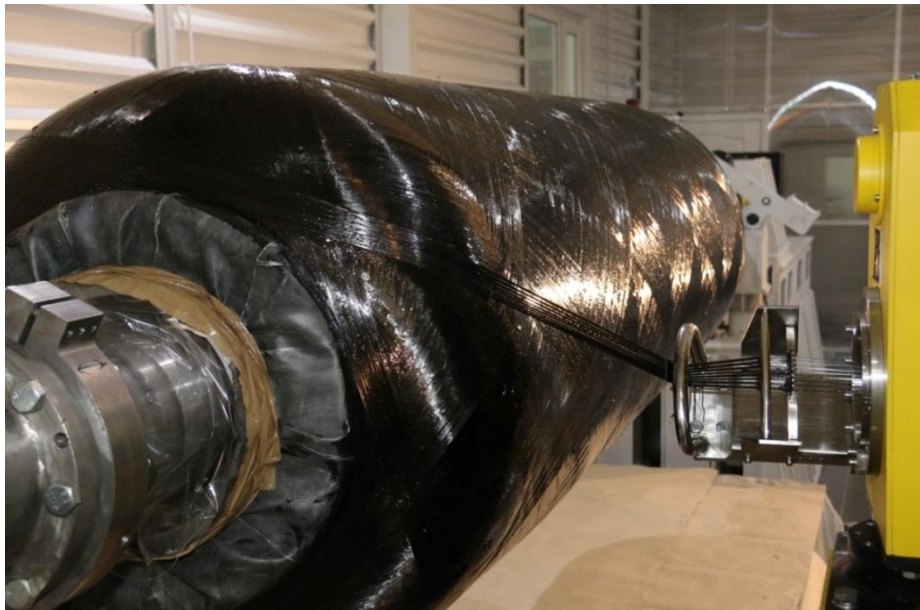
Рис. 3. Намотка силовой оболочки корпуса

Силую оболочку корпуса РДТТ изготавливают «мокрой» спирально-кольцевой намоткой углеродного волокна, пропитанного связующим на намоточном станке с программным управлением (рис. 3).