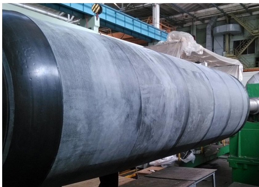
Рис. 2. Изготовление ВТЗП цилиндрической части корпуса РДТТ

После установки ТЗП днищ на оправку для изготовления корпуса РДТТ из высокоэффективных композиционных материалов послойно собирается ТЗП цилиндрической части: разделительный слой, барьерный слой, основная теплозащита и герметизирующий слой. Между основным ТЗП, герметизирующим слоем и силовой оболочкой наносится клей (рис. 2).